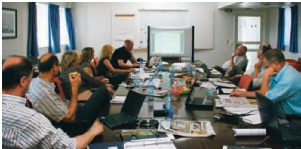
FU-meri hos riksmeklingsmannen.

pensjon ikke kunne røres uten godkjenning av LO/NNN. LA krevet protokolltilførselen ut av avtalen, og hevdet at pensjonsspørsmålet hørte hjemme i bedriften og ikke i tariffavtalen.