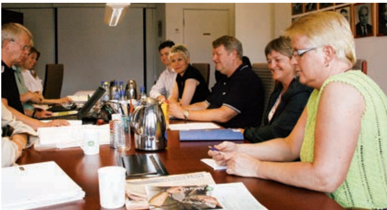
Fra LAs forhandlinger med Negotia/Økonomiforbundet