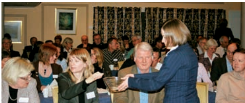
Møtedeltakerne avgir stemme

LAs årsmøte ble avholdt tirsdag 11. mars 2008. Årsmelding og regnskap ble godkjent.